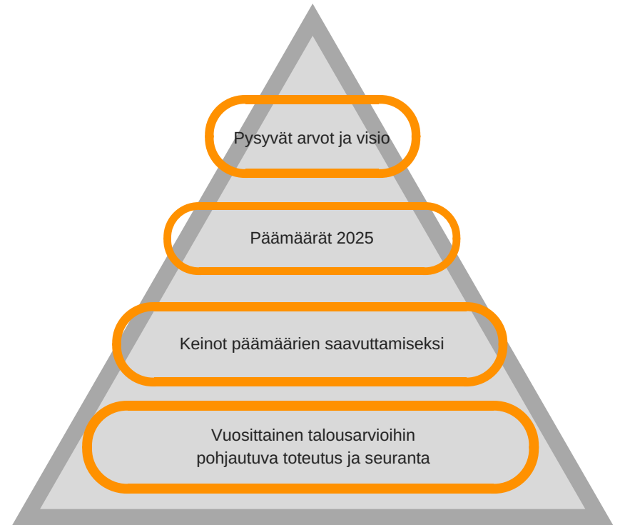
Kuva: Strategian rakenne